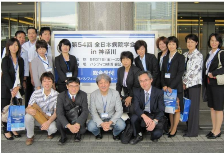
会場前にて、集合写真です。慈生会を代表して参加・発表してきました！

平成24年9月21日、22日の二日間、第54回全日本病院学会「神奈川がパンフィコ横浜で開催され、慈生会等潤病院からも演題発表をさせていただきました。全日本病院学会は年1回、医療従事者の学術研修を目的とした全日本病院協会の主催する学会で、日頃の経験や業務改善への取り組みを発表・議論し地域医療に貢献するために開催されています。全国から多数の出席者が集まり、大変熱気のある学会となりました。それぞれの演題に対して一般的な質問や専門的な質問など活発な意見交換がなされました。