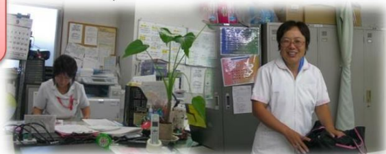
写真：訪問看護ステーションのスタッフの皆さんです。