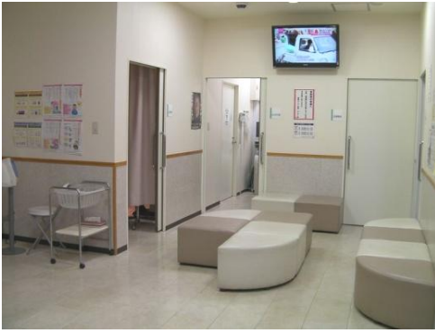
写真左：健診センター待合室