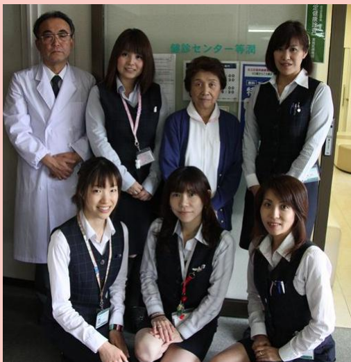
スタッフのみなさんです。健康診断は健診センター等潤で！

現在5月から足立区の特定期健診がスタートしており、毎年たくさんのご予約を頂いております。期間中は混み合うことも多いですが、気持ちよく健診をお受けいただけるよう、待ち時間の短縮、受診者様の立場に立った接遇にも力を入れております。 また、健診センター等潤の今後の取り組みとして、さらにきめ細かいニーズにお応えできるように「レディースドック」、「心臓ドック」、「肺ドック」などの新設も検討中です。 「年1回の健康診断は健診センター等潤で！」と言っていただけのようにスタッフ一同笑顔でお待ちしております。