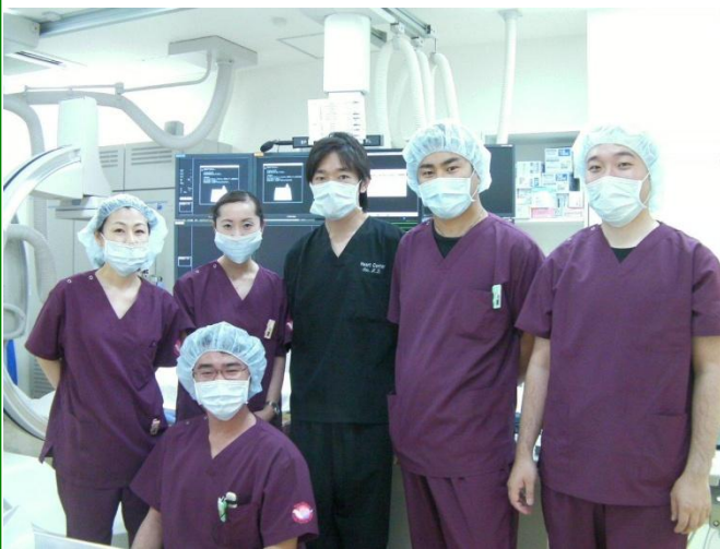
写真上：TPCVCチームの皆さんです！ 写真左下：モニター室 写真右下：カテーテル室

平成24年4月より等潤病院に等潤パートナーズ心臓血管センター(TPCVC)が開設いたしました。 当センターでは、心臓に酸素や栄養を与えている血管(冠動脈)が細くなったり詰まってしまった場合、カテーテル治療を含めた最先端の医療を行います。動脈疾患ではカテーテル治療と共にバイパス術などの外科的治療も行います。静脈疾患では静脈瘤に対する抜去術や硬化療法を行っています。また、透析を行っている患者さんへのシャント作成やシャントトラブルに対するアセスメントも行います。 等潤病院は都内で数台しか設置されていない320列CTを有しており、その他に1.5テスラMRIなどの最新鋭機器や心臓エコーなど低侵襲で外来診療でも可能な検査を活用し、心筋梗塞や脳梗塞などを大きな問題が起る前に早期発見・治療することで、患者さんの身体への負担軽減を考えております。