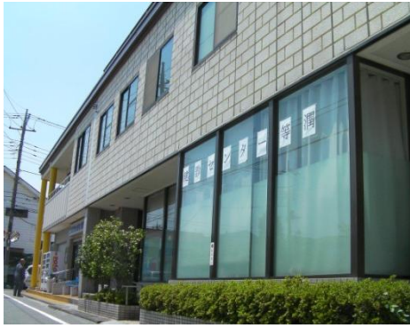
写真右：健診センターの外観 健診センターは、等潤病院の隣にあります。