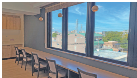
プラザホーム階(4階)の有料老人ホーム「やすらぎホーム常楽」。施設内には寛ぎの空間が広がる