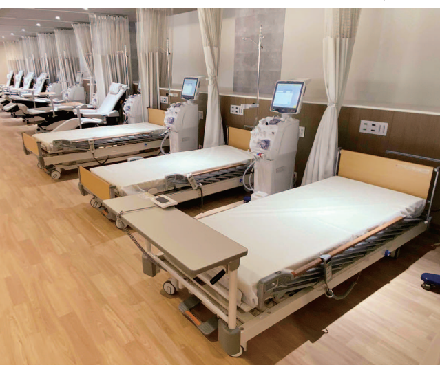
「腎センター等潤」(等潤メディカルプラザ病院2階)。30床が設置される地域最大級の人工透析センター

施設内には既存の等潤病院の機能を拡張して設置された「腎センター」「健診センター」「緩和ケアセンター」「等潤メディカルプラザ病院」のほか、在宅医療の支援施設「等潤メディケア診療所」、高齢者向けのデイケア・デイサービスを提供する施設や医療機関直結の有料老人ホームも設置されました。