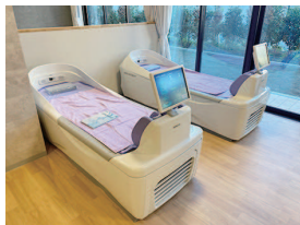
デイサービスのウォーターベッド