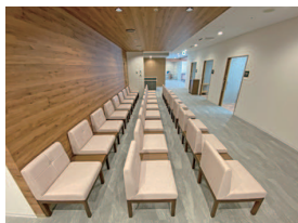
シックで洗練された「健診センター等潤」の待合室