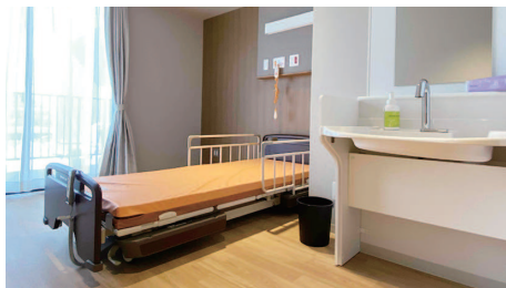
足立区とその近隣では初の緩和ケア施設となった「緩和ケアセンター等潤」の病室