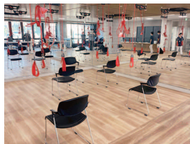
デイケアのリハビリ施設