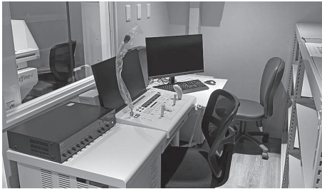
等潤病院では「トータルヘルスケア」推進のためICTも積極活用する

(院長) 緊急性の高い症状に即応できる体制の構築も地域医療増進に直結するとの考えによるものです。現在は二次救急医療機関、地域救急医療センターとして年間3000件以上の救急搬送を受け入れています。地域貢献の柱となる救急医療なので、今後も積極的に取り組んでい