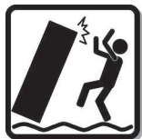
地震時の家具類の転倒に注意