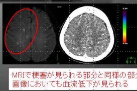
・MRIで梗塞が見られる部分と同様の部分画像においても血流低下が見られる